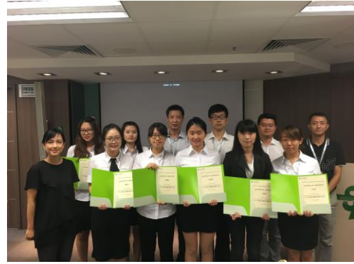
2016年暑期香港医疗「零距离交流」项目①结业典礼留影