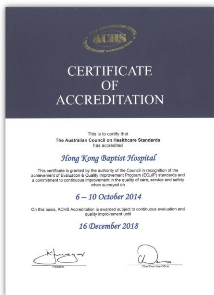
多次荣获「澳洲医疗服务标准委员会」（ACHS）认证

香港浸信会医院由1950年的一所诊所渐渐发展至今天的全科医院。多年来，医院致力拓展多元化服务，包括开设不同的专科医疗中心，致力提升服务素质达国际级水平，满足现今社会对高素质医疗服务的需求。医院提供全面的门诊服务，包括家庭医学、专科及特别门诊，为病人提供全天候的高素质诊断、治疗及护理服务，尤其注重病人身、心、社、灵的需要，致力实践「全人医治」的理念。