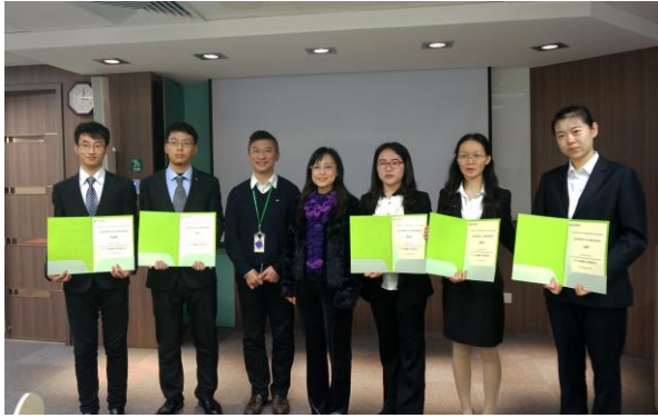
2016年寒假香港医疗「零距离交流」项目结业典礼留影