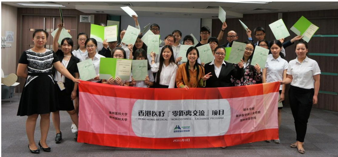
2016年暑期香港医疗「零距离交流」项目②结业典礼合影