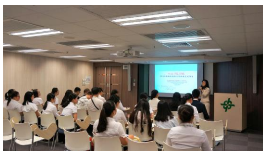
2016年寒假香港醫療「零距離交流」 項目浸信會醫院留影