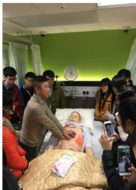
2016年暑期香港医疗「零距离交流」项目②与香港医学生合影