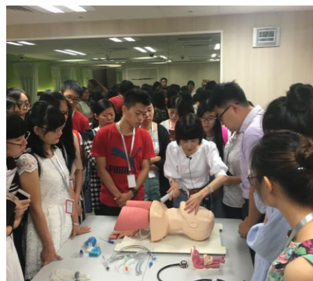
2016年暑期香港医疗「零距离交流」项目②临床模拟训练留影