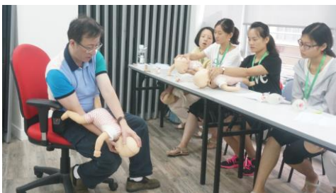
2015年暑期香港医疗交流项目小组报告讨论留影