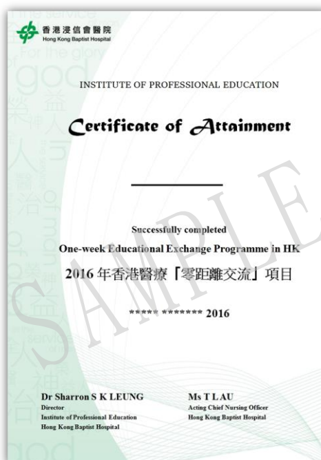
香港医疗「零距离交流」项目证书样本