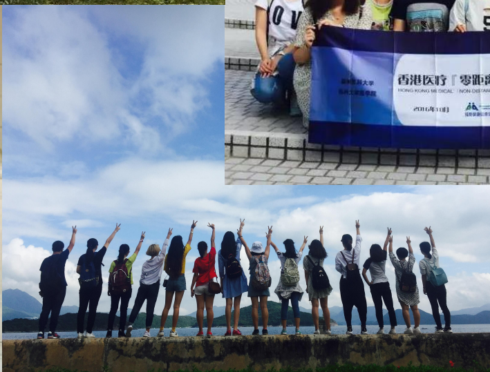
◆ 游览香港大学及香港科技大学