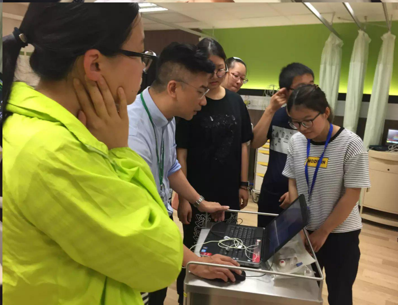
◆ 《临床技能模拟训练》剪影