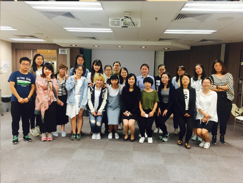
与香港医学生面对面交流剪影