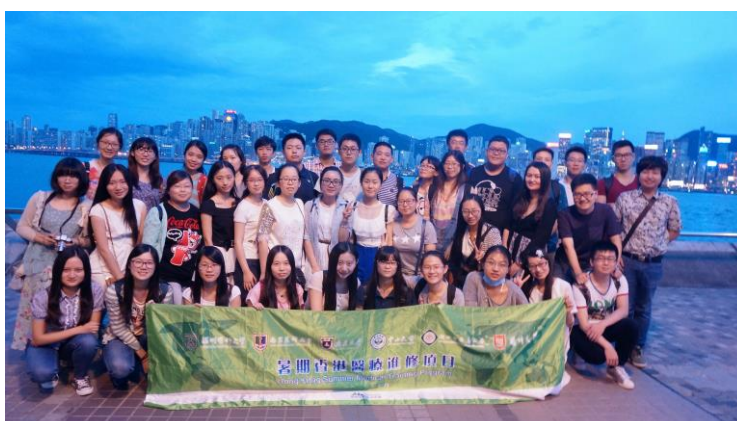
2015年暑期香港 医疗进修项目 (2) 维多利亚港 留影