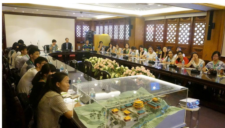
2015年暑期香港醫療進修項目 (2) 荃灣港安醫院前留影