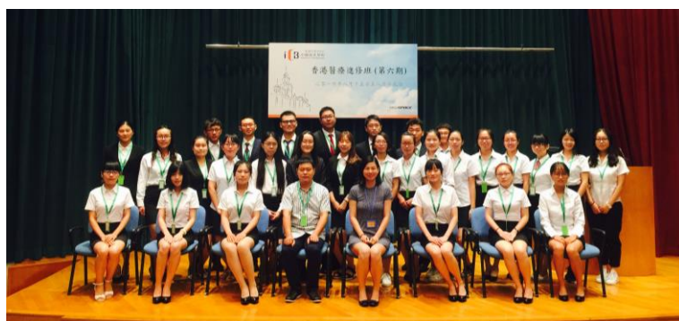
2016年暑期香港医疗 进修项目（6）开学 典礼留影