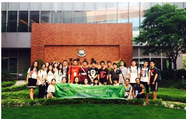
2015年暑期香港医疗进修项目(3)游览香港大学留影