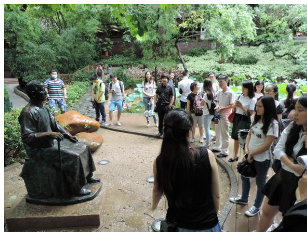
2016年暑期香港医疗进修项目(6)参观香港大学李嘉诚医学院留影