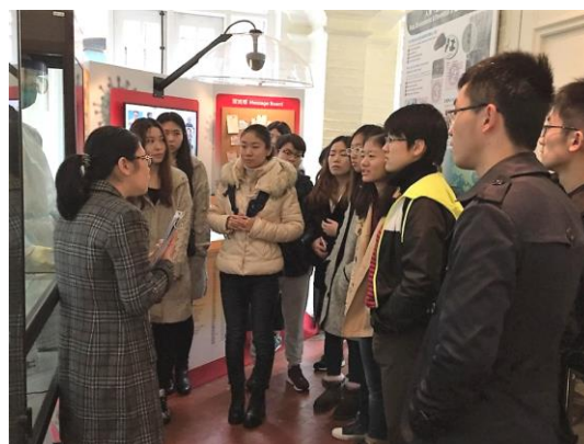
2016年暑期香港医疗进修项目 (6) 香港医学博物馆前留影