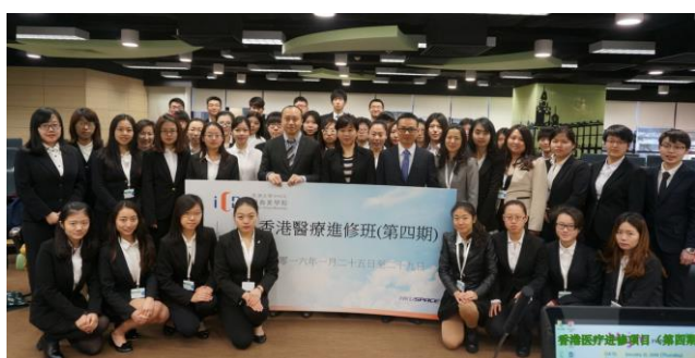
2015年暑期香港医疗进修项目 (2) 结业典礼留影