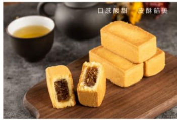
手工土鳳梨酥 Pineapple Cake