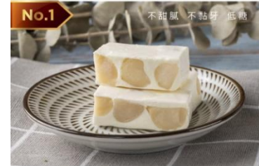
夏威夷果仁牛軋糖 Macadamia Nut Nougat