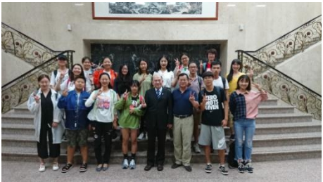
正心楼大厅(结业照)