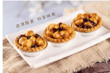
焦糖夏威夷莓果塔 Caramel Cranberry Macadamia Nut Tart