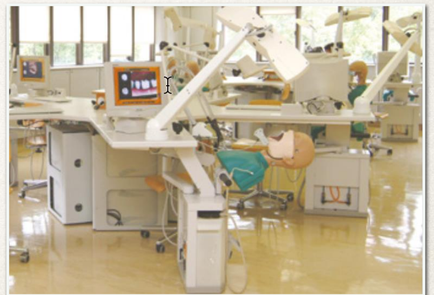
（香港大学牙医学院 诊室）