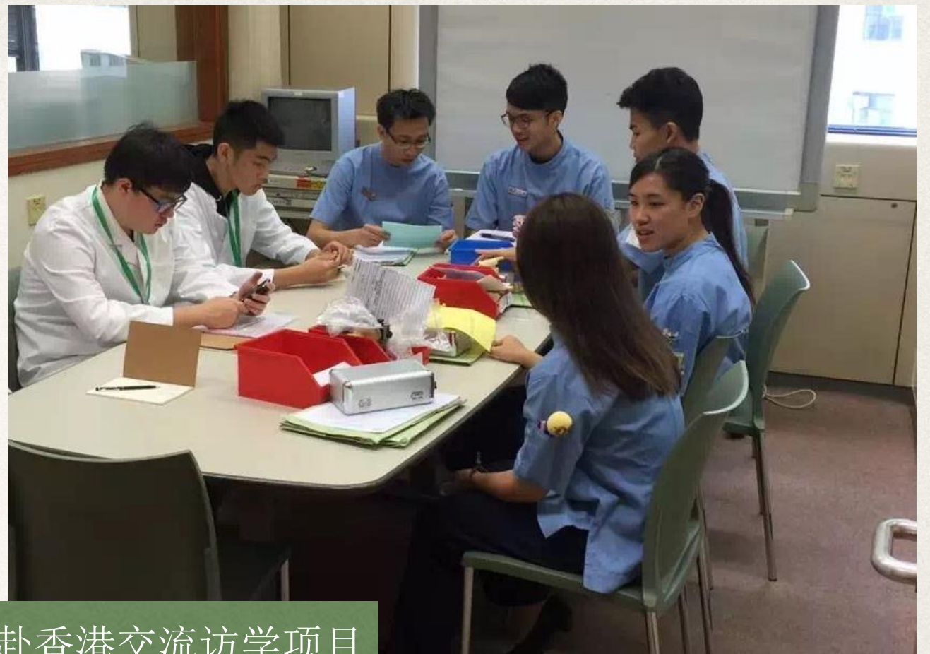
口腔专业医学生赴香港交流访学项目 (2016年5月1日-11日) 第一期